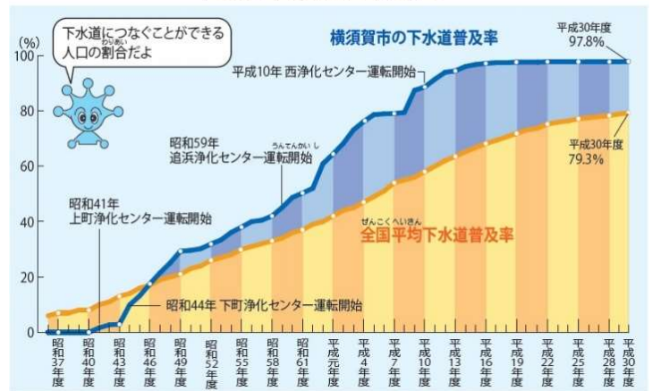
下水道処理人口普及率の移り変わり